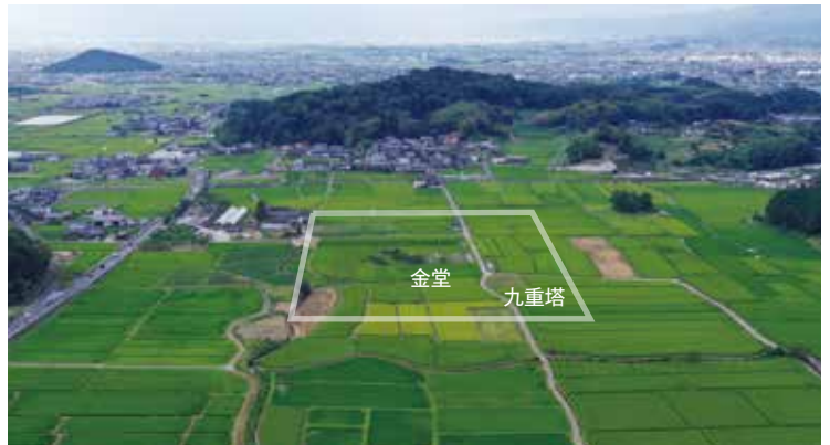
大官大寺跡 全景（奥に香具山・耳成山が見える。）