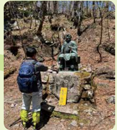
修験道当山派の開祖・理源 りげん にゆかりの聖宝宿跡 しょうぼうしゆく で大師に参拝。