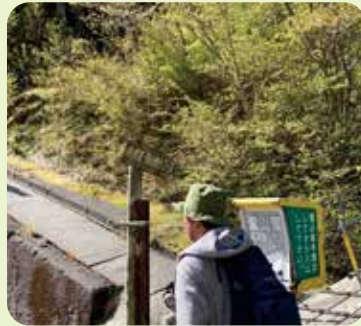
行者還トンネル西口の登山口から、登山届を出して、いざ出発！

今回、その室員有志で「紀伊山地の霊場と参詣道」の構成資産である大峯奥駈道を登山した様子をレポートします。