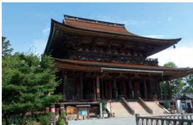
第73番行所 金峯山寺蔵王堂 現在の蔵王堂は1592年に再建されたものですが、1103年までには建立されていたことが確認できます。