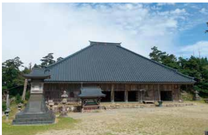
第67番行所 大峰山寺本堂 905年までには本堂が創建されたと考えられます。解体修理の際には金製の仏像2体等が出土しました。