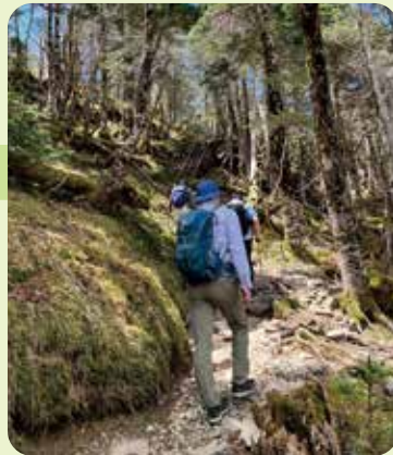
「聖宝八丁」という難所に差し掛かる。 弥山の頂上には、いつ辿り着けるのかと、心が折れそうになるのをこらえて、歩みを進める室員一行