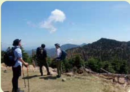
1895mの弥山の頂上に到着。 目の前に近畿最高峰の八経ヶ岳！ ここから一度下って、また登る