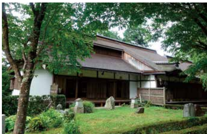
吉水神社 現在は神社となっていますが、近世以前は金峯山寺の中心的な附属寺院でした。