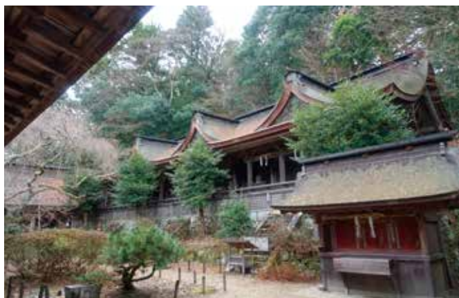
第72番行所 吉野水分神社本殿 吉野山における分水嶺に対する信仰を起源とした神社。最も古いもので698年の記録があります。