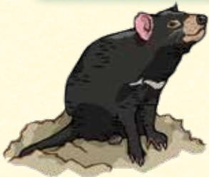
タスマニア原生地域 (オーストラリア、1982・1989)