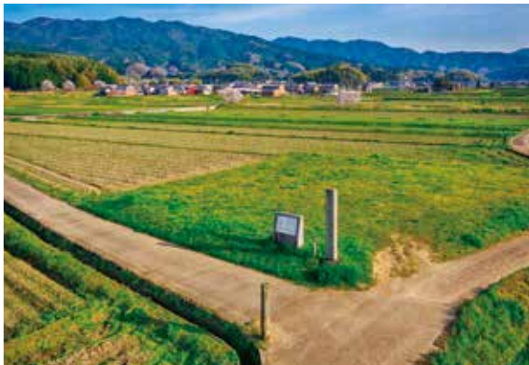
大官大寺跡 九重塔跡

発掘調査では、講堂跡や回廊跡、中門跡、寺域を囲む柱列なども確認された他、文献に記録されたとおり、火災で建物が焼け落ちた時の痕跡も確認されました。