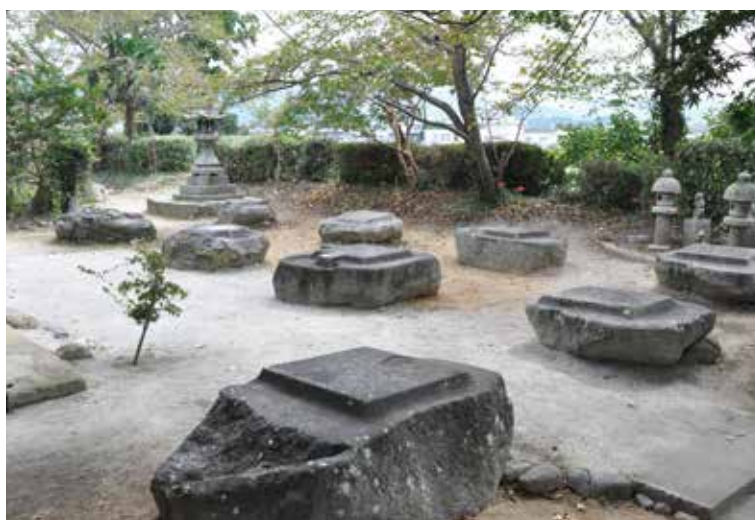
本薬師寺跡 金堂跡の礎石