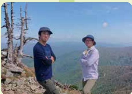
1915mの八経ヶ岳の頂上に到着。 下山も最後まで気を緩めずに